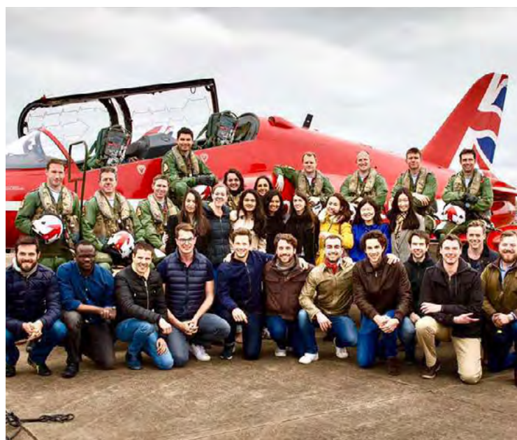
参观英国皇家空军