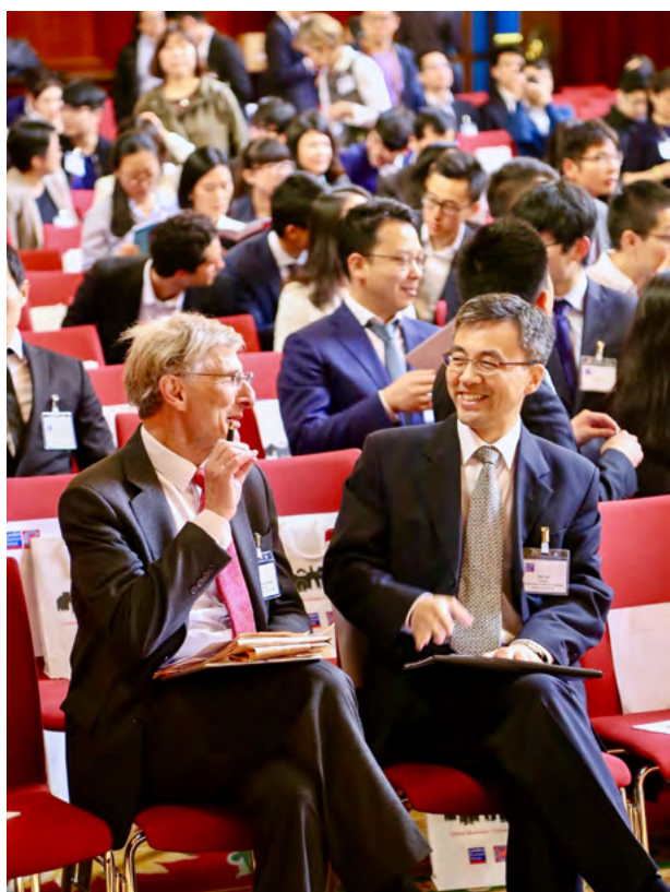
驻英国使馆祝勤公使出席中国商业论坛