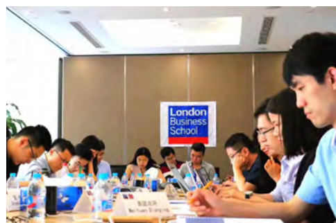
China Club 成功举办人工智能投融资路演

◆ 人工智能路演：路演通过远程视频演说的形式，增进中国投资者对英国人工智能创业公司的了解，也为创业公司提供对接中方资源的平台。路演邀请了逾 20 家中国投资企业，包括百度、京东、君联资本、真格基金、贝塔斯曼、晨星资本、九鼎投资等。另一方面，9 家英国人工智能创业公司从 200 多家候选公司中脱颖而出，参与路演展示。