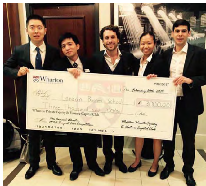
LBS 获得 2017 年 Wharton PE Competition 冠军

有如下七个“专业”领域供学生选择：Finance、Change Management、Economics、Entrepreneurial Management、Marketing、Private Equity、Strategy。