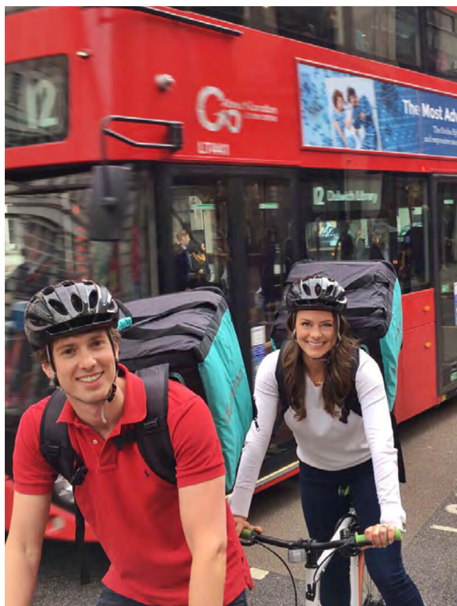
参观 Deliveroo，体验当“外卖骑士”

合作参与 LondonCAP 的公司包括：AB InBev、Amazon、Aston Martin / Investindustrial、Bank of England、British Fashion Council、Cabinet Office、BBC Channel 4、Deliveroo、Fulham FC、NHS、Mayor of London、PayPal、Royal College of Art、Transport for London、Thomson Reuters 等。