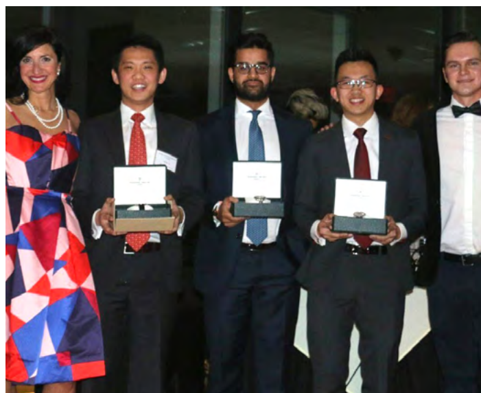
LBS 获得 2017 年 Harvard Global Case Competition 冠军