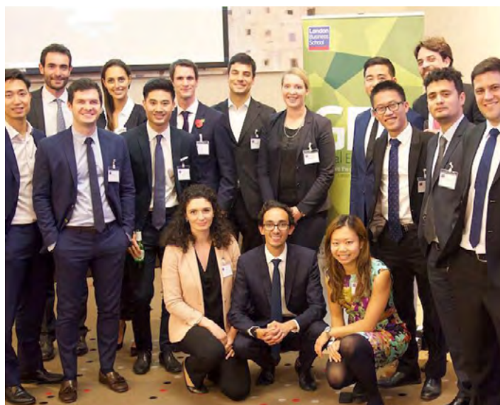
LBS 举办 Global Energy Summit

教学形式多样：LBS 的课程采用多种教学模式结合的方式，包括案例教学、小组合作项目、个人作业等。课程介绍中会标明本课程所采用的教学方法，以便学生根据自己的喜好选择合适的课程。