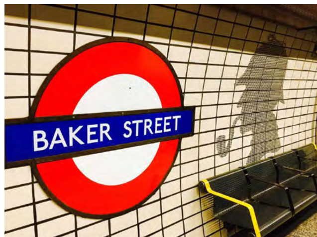
Baker Street 地铁站

学院景色优美，课余时间同学们常在学院的后花园中聚会聊天，亦或是去摄政公园中跑步锻炼或喂食野鸭、鸽子等飞禽。