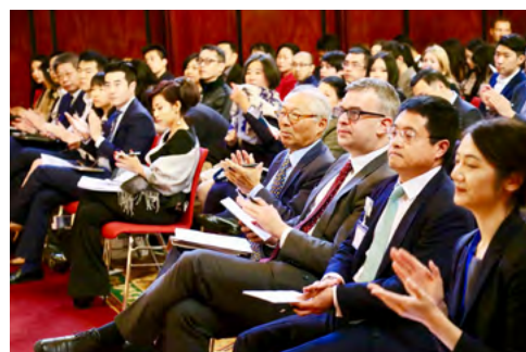
中国商业论坛开幕