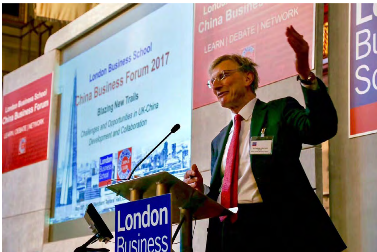
LBS 院长在中国商业论坛致欢迎辞

简要地和大家分享一些 LBS 的最新消息。首先，新的教学大楼（The Sammy Ofer Centre）近期已经交付，即将投入使用，投入后可以提升 70% 教学空间。大楼将会成为 LBS 校园重要的一部分，与现有的 Sussex Place 及 Taunton Centre 一起，组成校园的铁三角。其次，LBS 提前两年超额完成了建校 50 余年以来的第一次大规模筹款，短时间内筹集了 1.25 亿英镑的校友捐赠。这些款项将作为新教学楼的发展经费，并用于进一步吸引世界级的教员、增加对优秀学生的奖学金，以及投资到最新的科技及学院发展项目中。